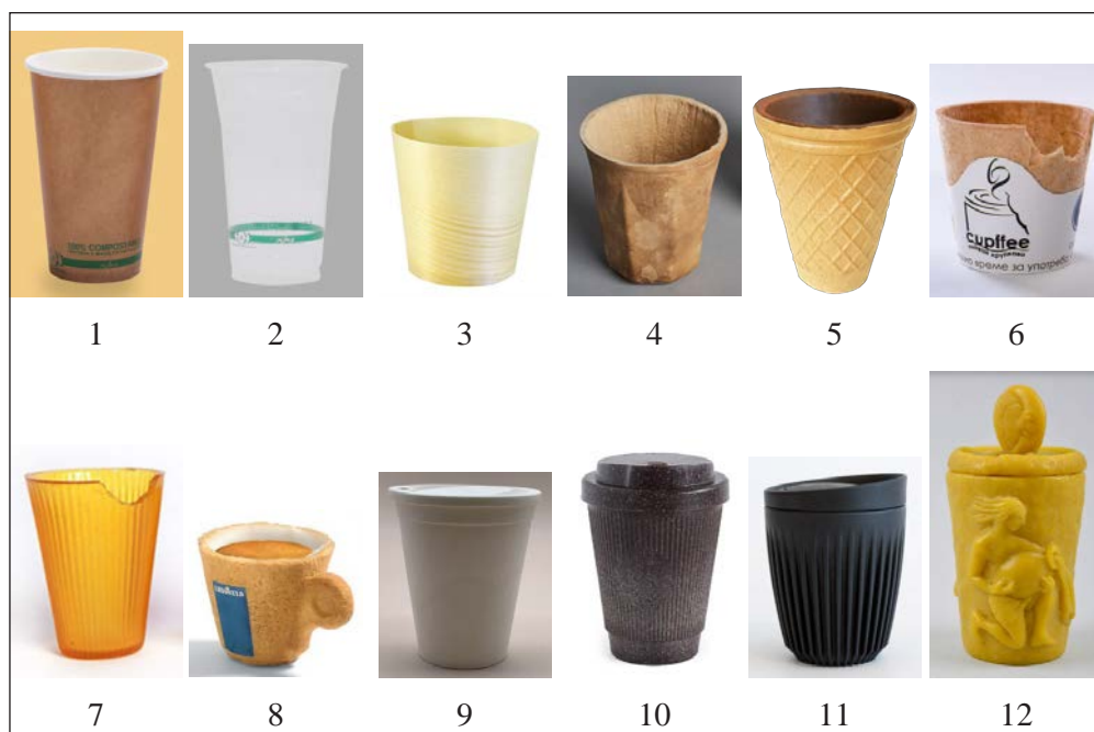
Рис. 2. Приклади стаканів на біологічній основі

Виклад основного матеріалу дослідження. Нами розроблено технологію нового виду тари – одноразових стаканчиків для кави, кавових напоїв