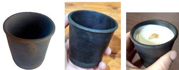
Рис. 3. Зовнішній вигляд розробленого одноразового стаканчика без напою та з кавою

На рис. 3 представлено фотографію лабораторного зразка стаканчику номінального об'єму 250 мл без напою та з кавою.